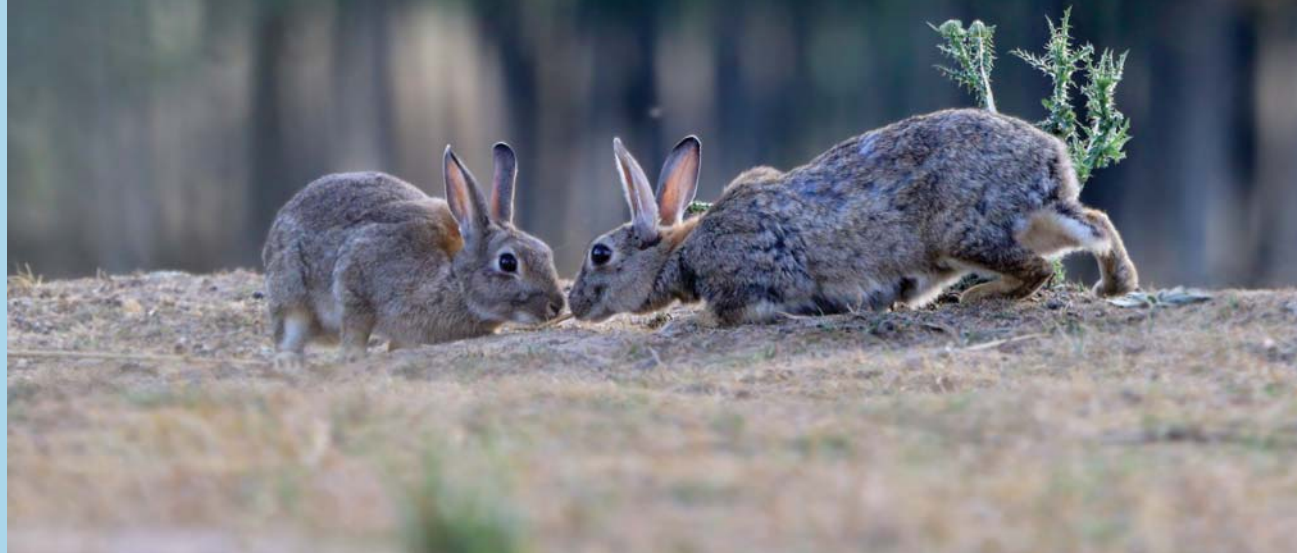
Králík divoký

Milé děti, poznávat zvířátka je pro milovníky přírody hračka. Ale kdo ví, odkud se tu různí živočichové vzali a kteří patří mezi „pravé šumaváky“? Zkuste tento pomyslný tvrdý oříšek rozlousknout v následujících úkolech.